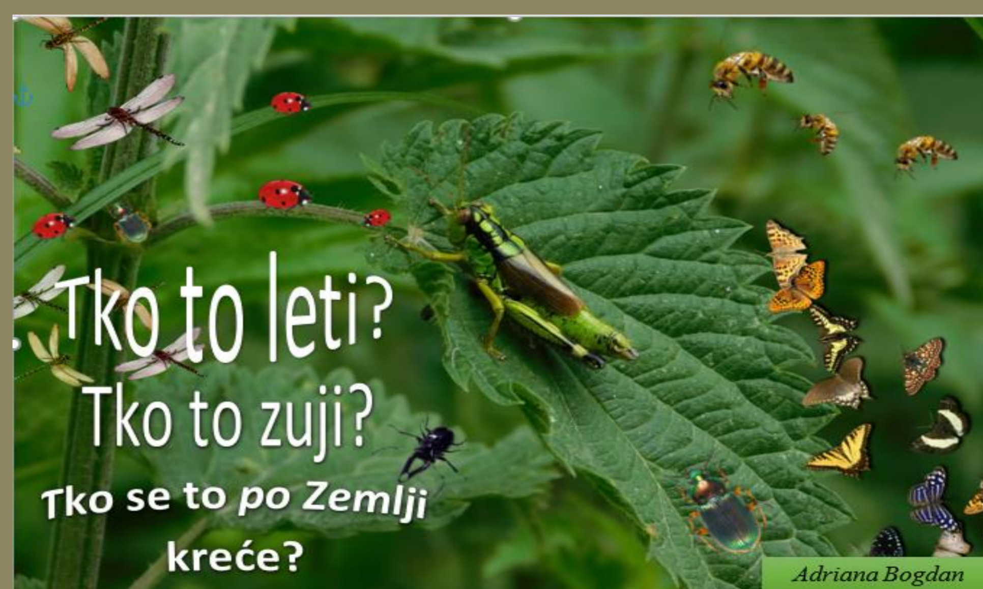
Slika 3 Edukativna eko-slikovnica o kukcima – naslovna stranica.

Zbog uočenog manjka edukacijskog materijala o kukcima, a u okviru aktivnosti s učenicima o poznavanju kukaca, izrađena je i edukativna eko-slikovnica o kukcima „Tko to leti? Tko to zuji? Tko se to Zemlji kreće?“ (Slika 3).