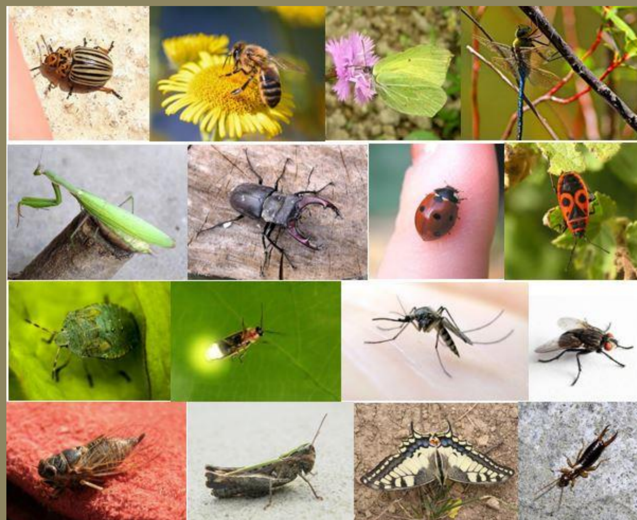
Slika 1 Fotografije kukaca upotrijebljenih u testu; s lijeva na desno:

Cilj istraživanja bio je provjeriti koliko učenici razredne nastave poznaju kukce. Ispitanici su bili učenici Osnovne škole Dr. Franjo Tuđman, Beli Manastir, Osnovne škole Matija Gubec, Čeminac i Osnovne škole August Šenoa, Osijek. Ukupan broj ispitanika je 67 (na istraživanje je utjecala epidemiološka situacija pojave virusa COVID-19). Test znanja odnosio se na izgled, specifičnosti kukaca i njihove uloge u prirodi (18 pitanja), a drugi dio se odnosio na prepoznavanje kukaca prikazanih na 16 fotografija (Slika 1).